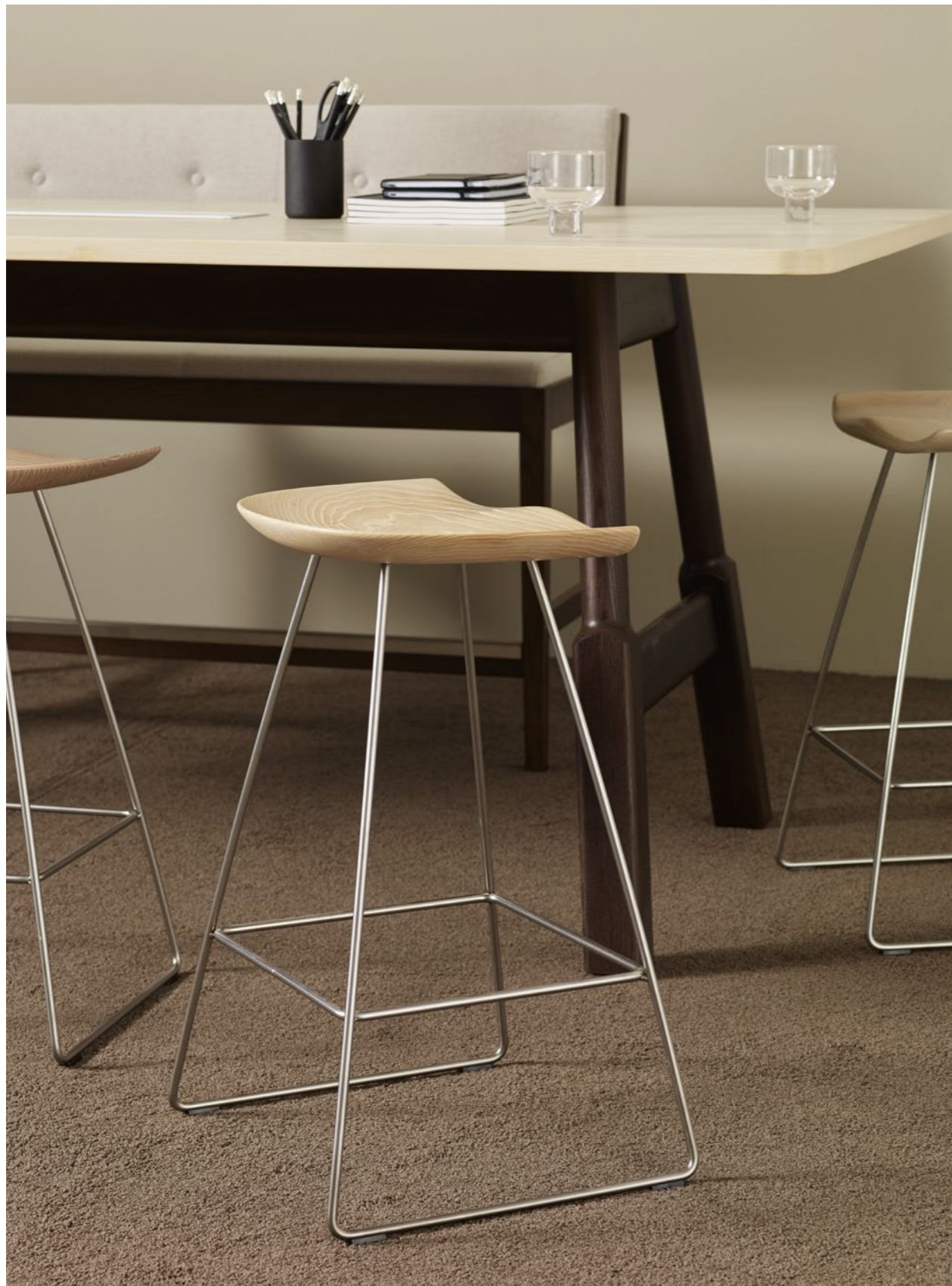
Pall Stool KAZP65M | Bord Table WOODWORK | Sofa Sofa FACILE