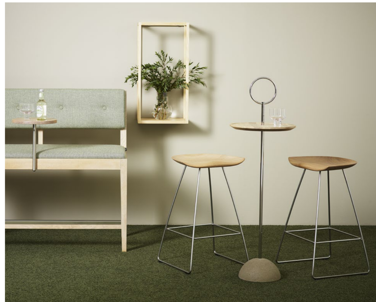
Pall Stool KAZP65M | Bord Table LOLLIPOP | Soffa Sofa FACILE | Hylla Storage CUBE BRICK