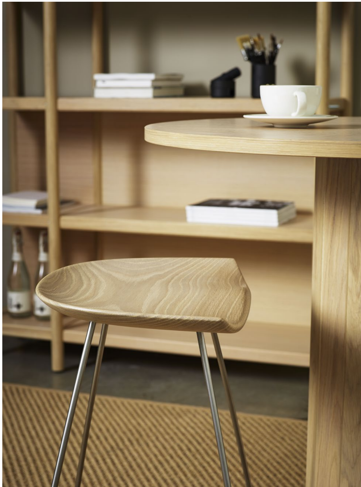
Pall Stool KAZP65M | Bord Table CAP | Skåp Storage CAVETTO