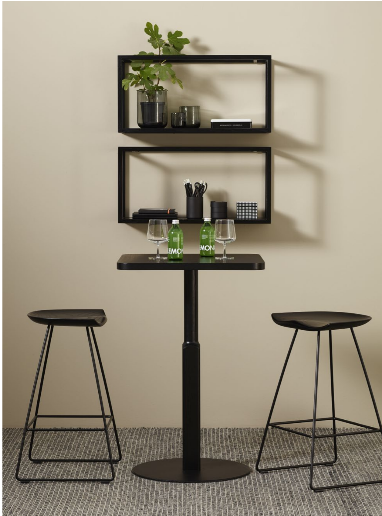
Pall Stool KAZP655 | Pelarbord Pedestal table WOODWORK | Hylla Shelf CUBEBRICK