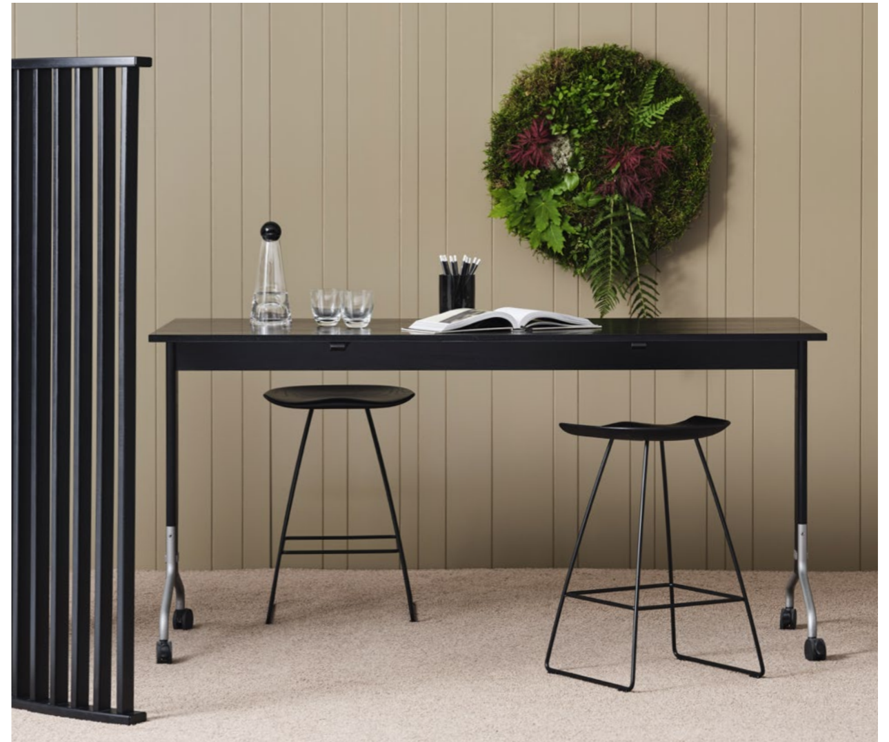
Pall Stool KAZP655 | Fällbord Folding table ROLLO | Rumsavdelare Room divider RAY