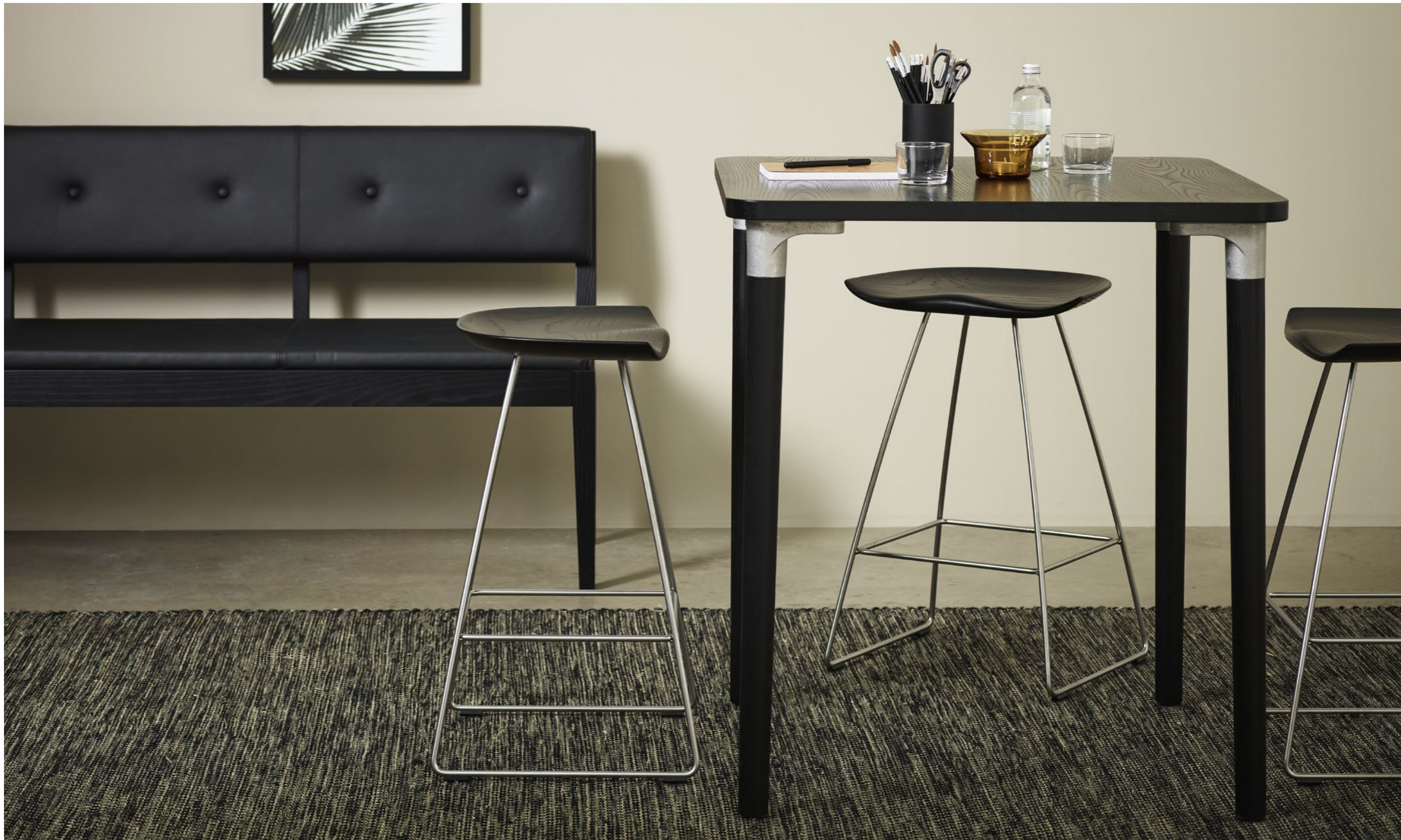
Pall Stool KAZP65M | Bord Table TAILOR | Soffa Sofa FACILE