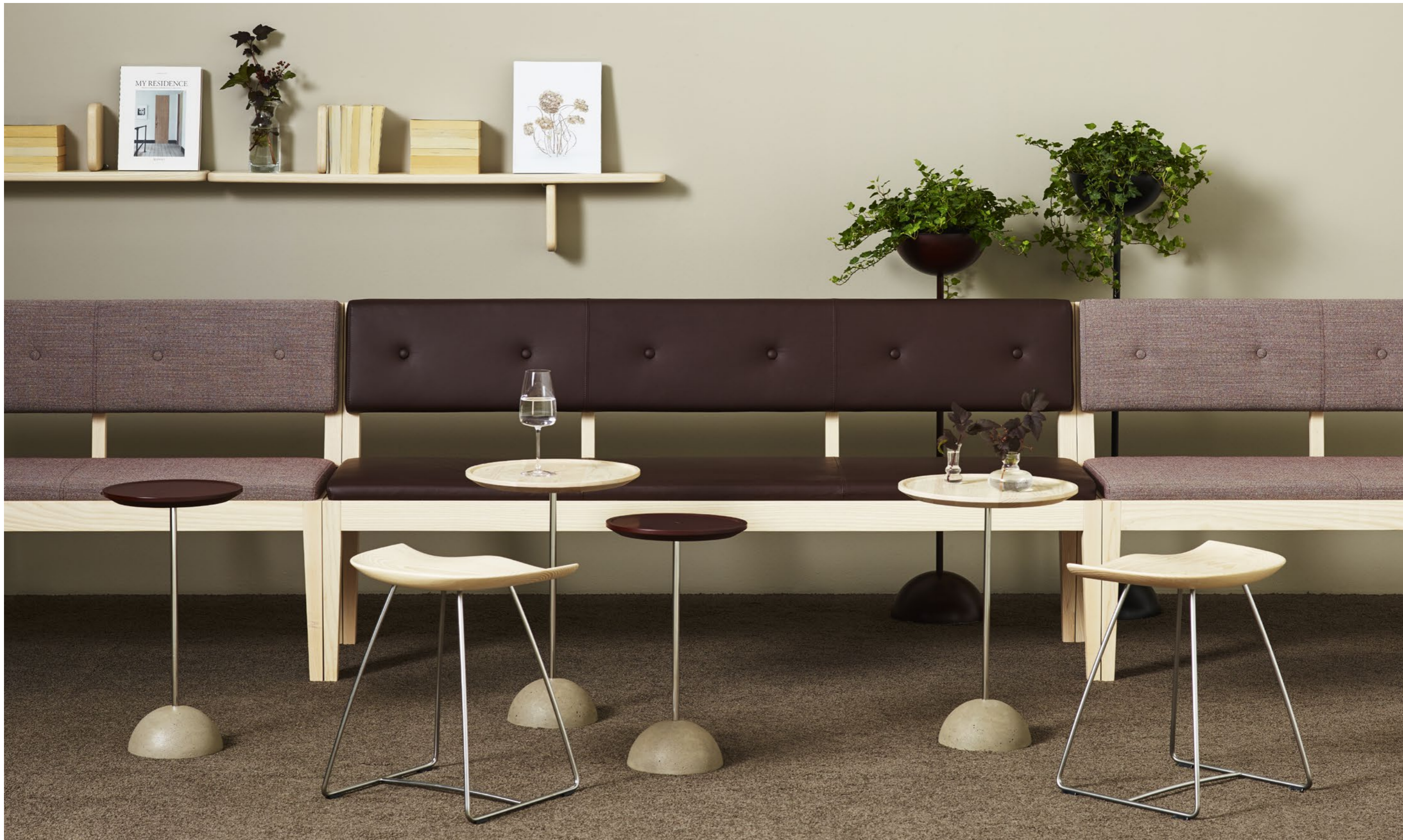
Pall Stool KAZP45M | Bord Table LOLLIPOP | Soffa Sofa FACILE | Hylla Shelf PART | Skål Bowl LOLLIPOP