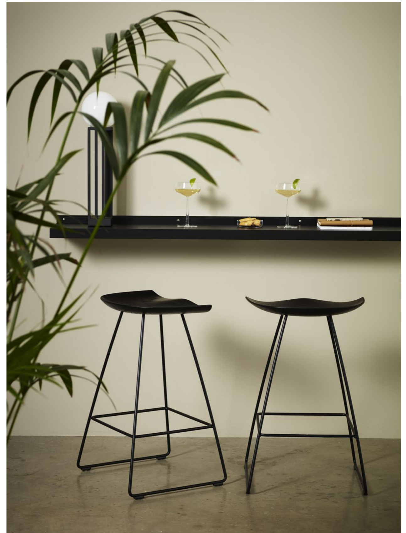
Pall Stool KAZP65S | Hylla Storage FRONT