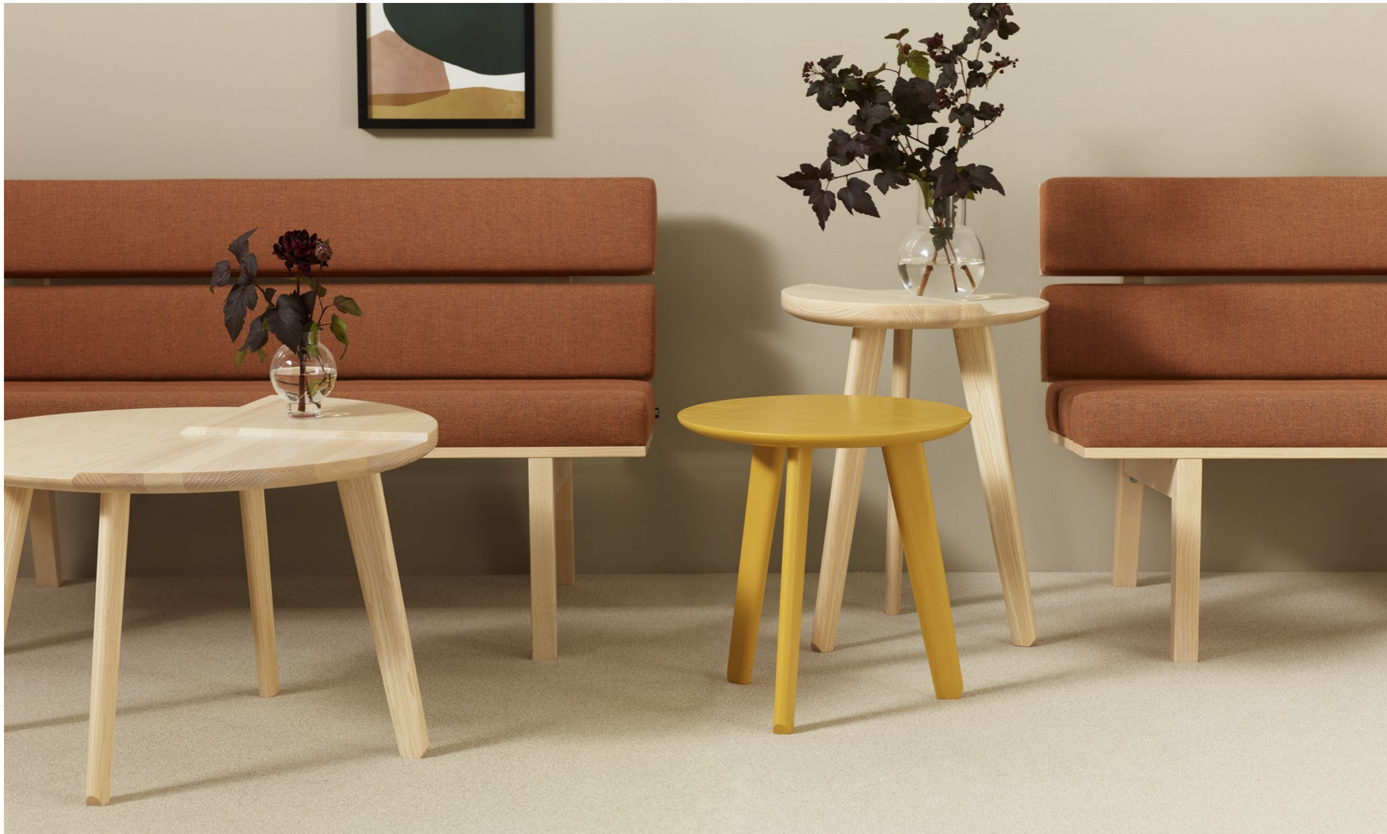
Bord Table TN3 73453 H 450, TN3 45572 H 570, TN3 45331 H 330 (specialbets special stain NCS S2050-Y10R, yellow)