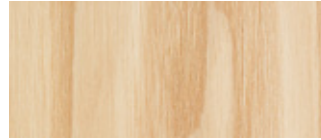
.30 Ask Ash

Standardbets: Bets på ek eller ask om inget annat anges. Topplack är klarlack i glansvärde 18, halvmatt. Specialbetsar enligt insänt prov kan erbjudas.