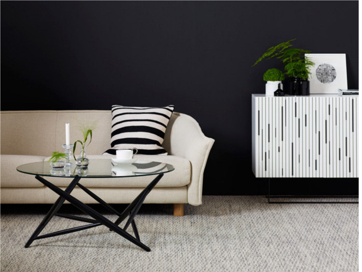
Bord Table SX1395 | Skåp Cabinet GUESS | Soffa från Sofa from SWEDESE