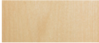
.20 Björk Birch