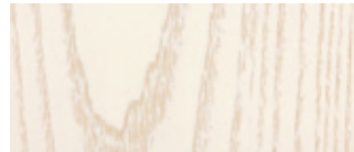
.13 Snövit bets Snow white stain