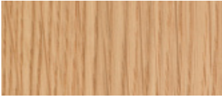
.10 Ek Oak

Wood: Treated with clear lacquer in a no. 18 semi-matt finish. Other available finishes are oil or oil + lacquer.