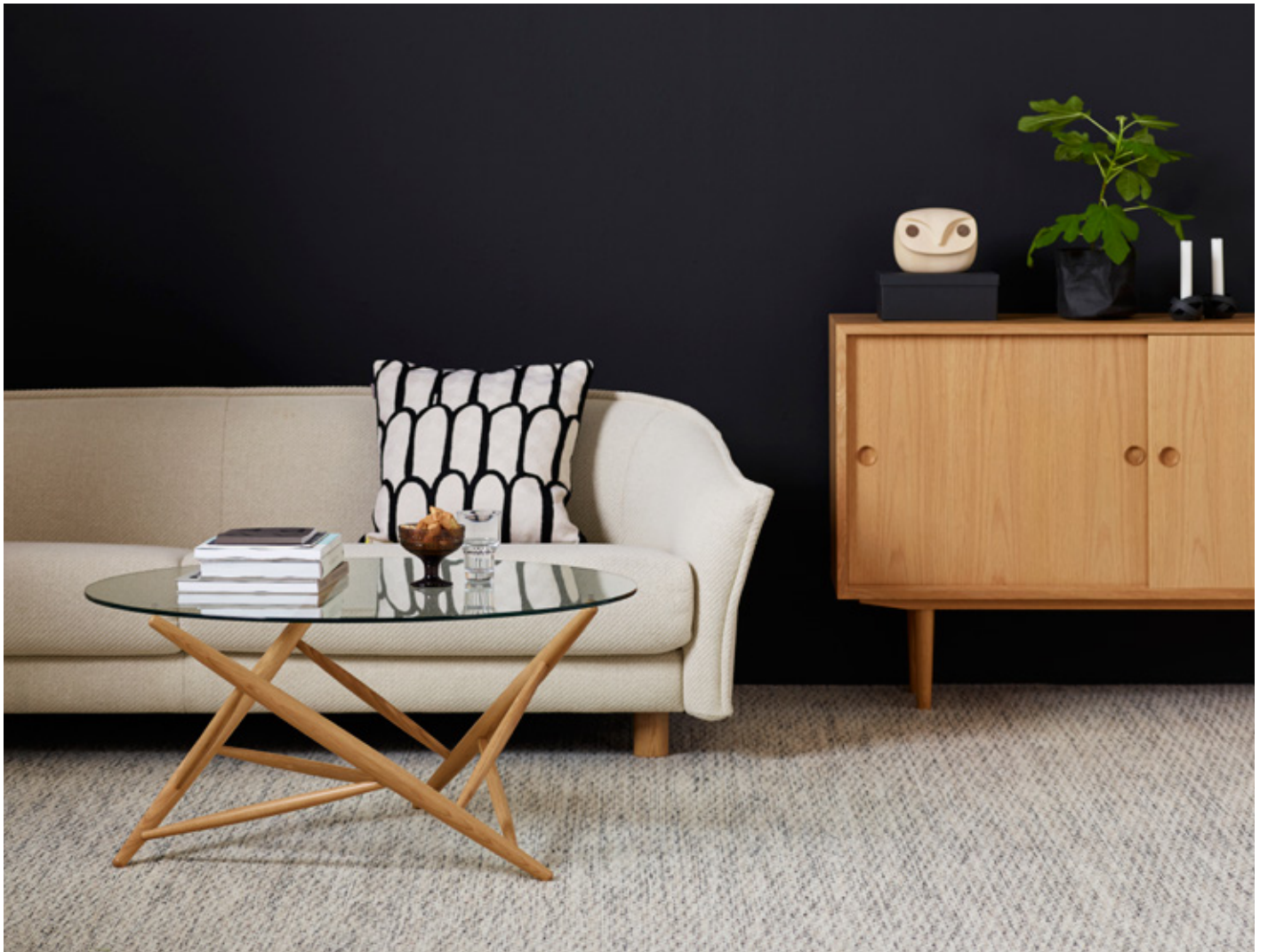
Bord Table SX1395 | Skåp Cabinet ØRESUND | Soffa från Sofa from SWEDESE