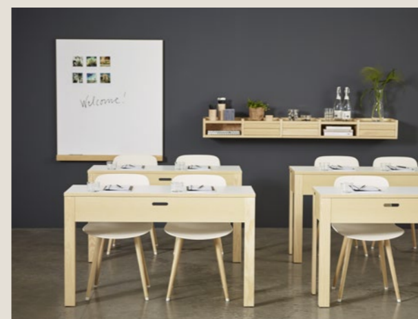
Bord Table SU1 12045 | Whiteboard FRONT | Hylla Shelf 1KM DISPLAY | Stol från Chair from Lammhults