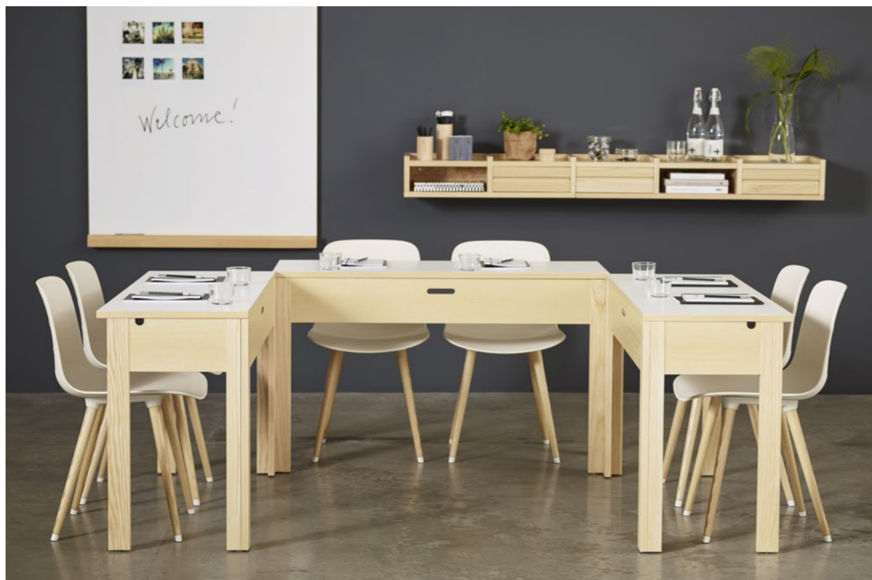
Bord Table SU1 12045 | Whiteboard FRONT | Hylla Shelf 1KM DISPLAY | Stol från Chair from Lammhults