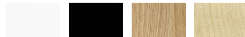
.60 Vit White NCS S0502-G50Y