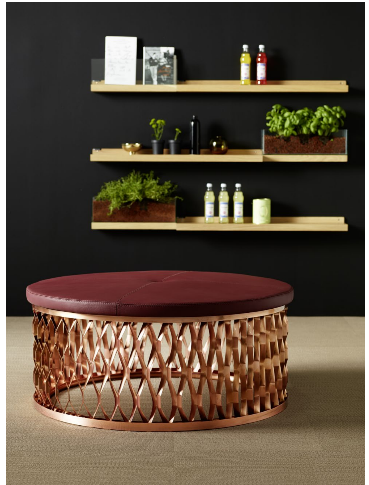
Sitt-ö Stool SO105 | Hylla Tidskriftsställ Shelf Magazine shelf FRONT