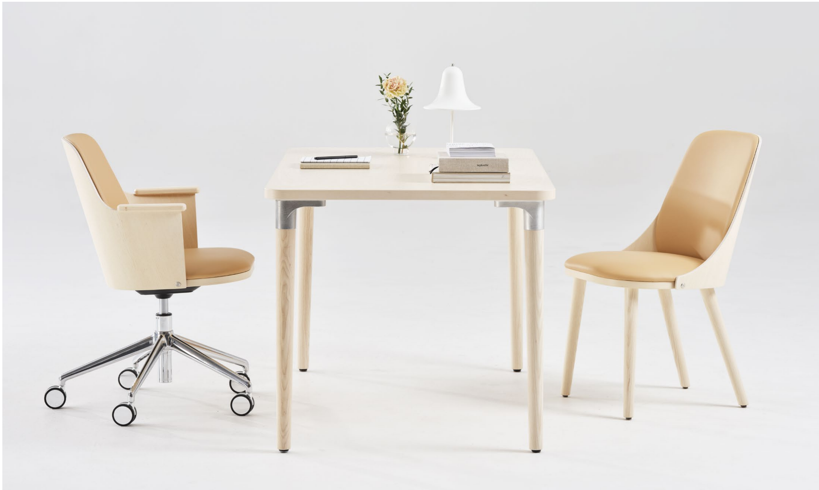
Stol Chair SAM616p | Bord Table TAILOR | Stol Chair SANDERCHAIR