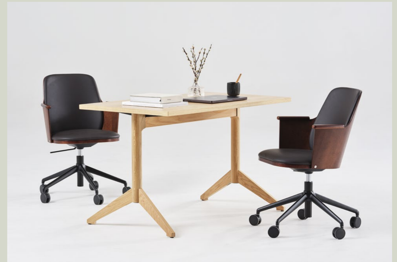
Stol Chair SAM616s | Bord Table LOCUS