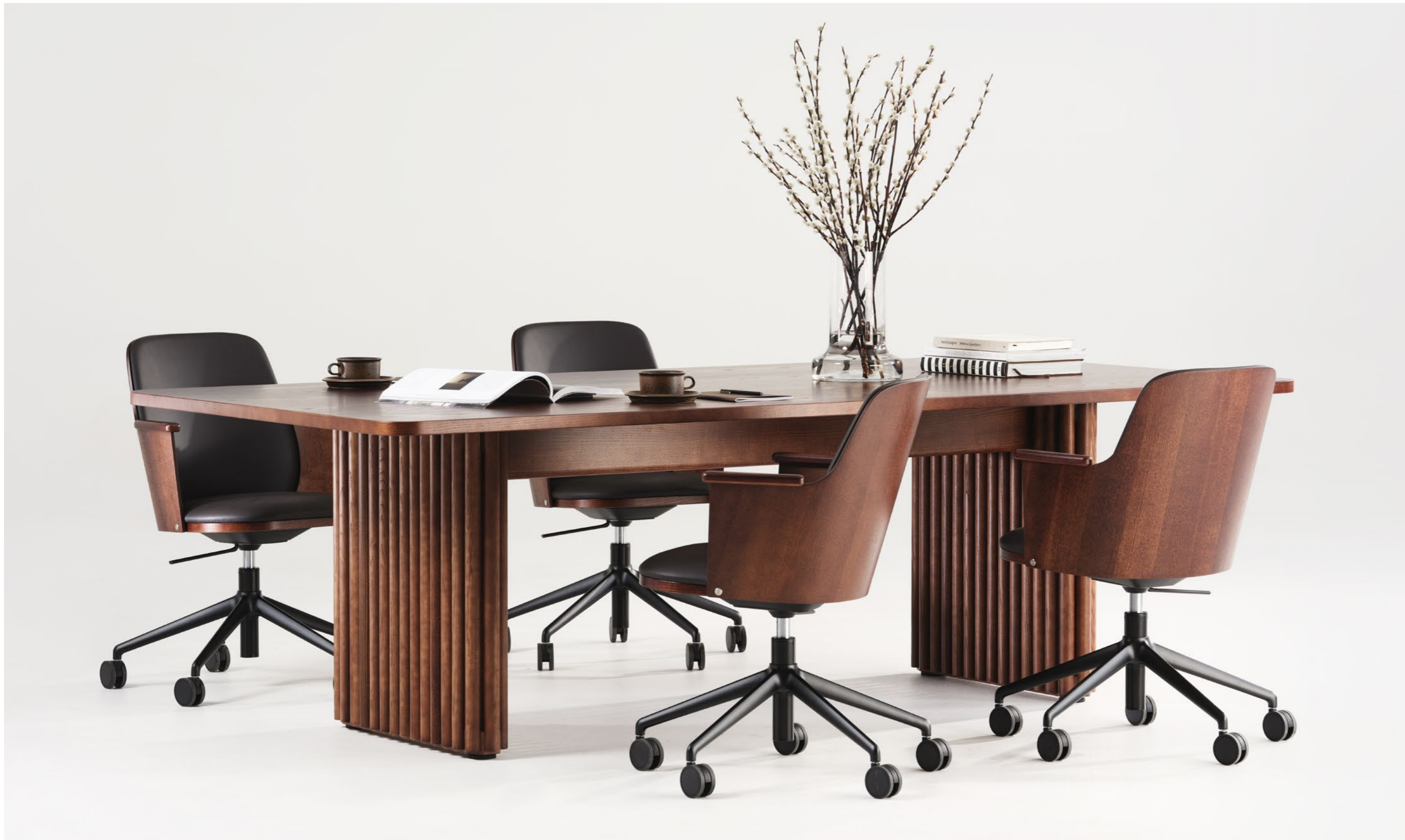
Stol Chair SAM616s | Bord Table OPERA