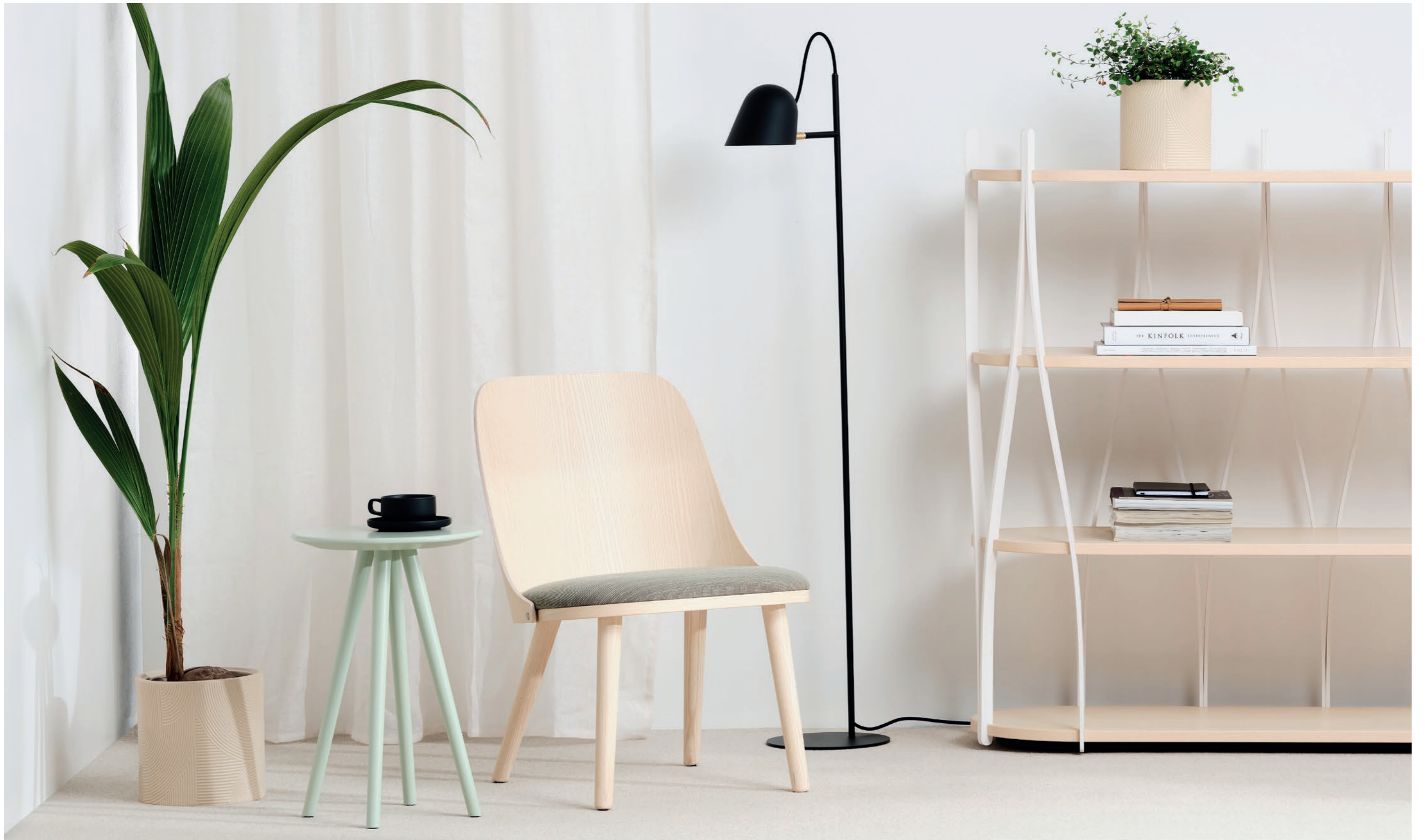
Fåtölj Easy chair SAF100 | Bord Table EIGHT | Hylla Shelf ALVA | Armatur Lighting from Örsjö