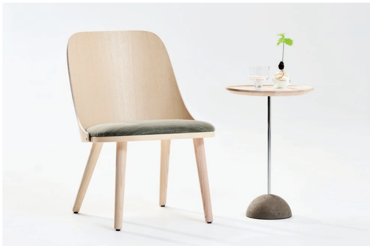
Fåtölj Easy Chair SAF100 | Bord Table LOLLIPOP