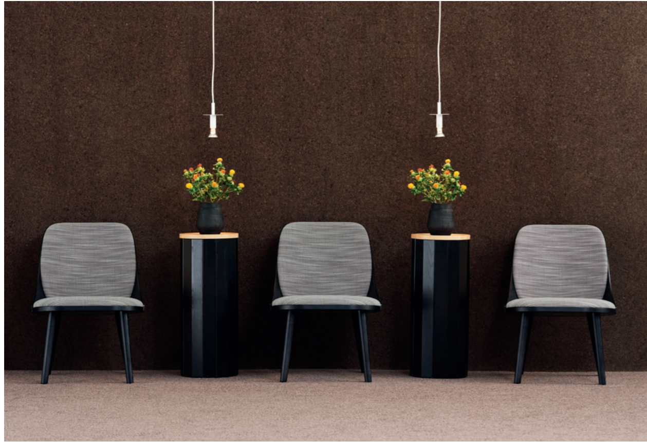
Fåtölj Easy chair SAF110 | CAP PODIUM | Armatur Lighting from Örsjö