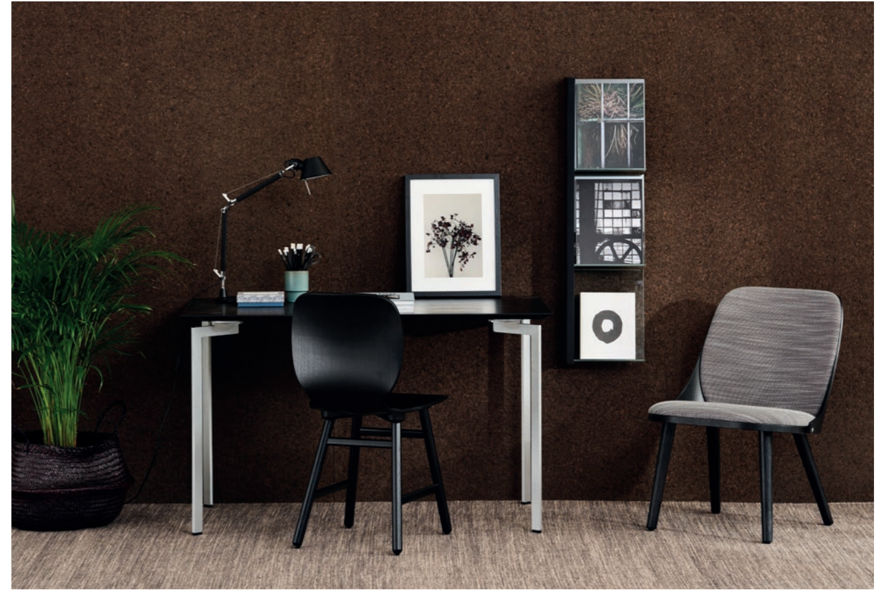
Fåtölj Easy chair SAF110 | Bord Table TRIPPO | Stol Chair SHELL | Tidskriftsställ Magazine shelf ELL