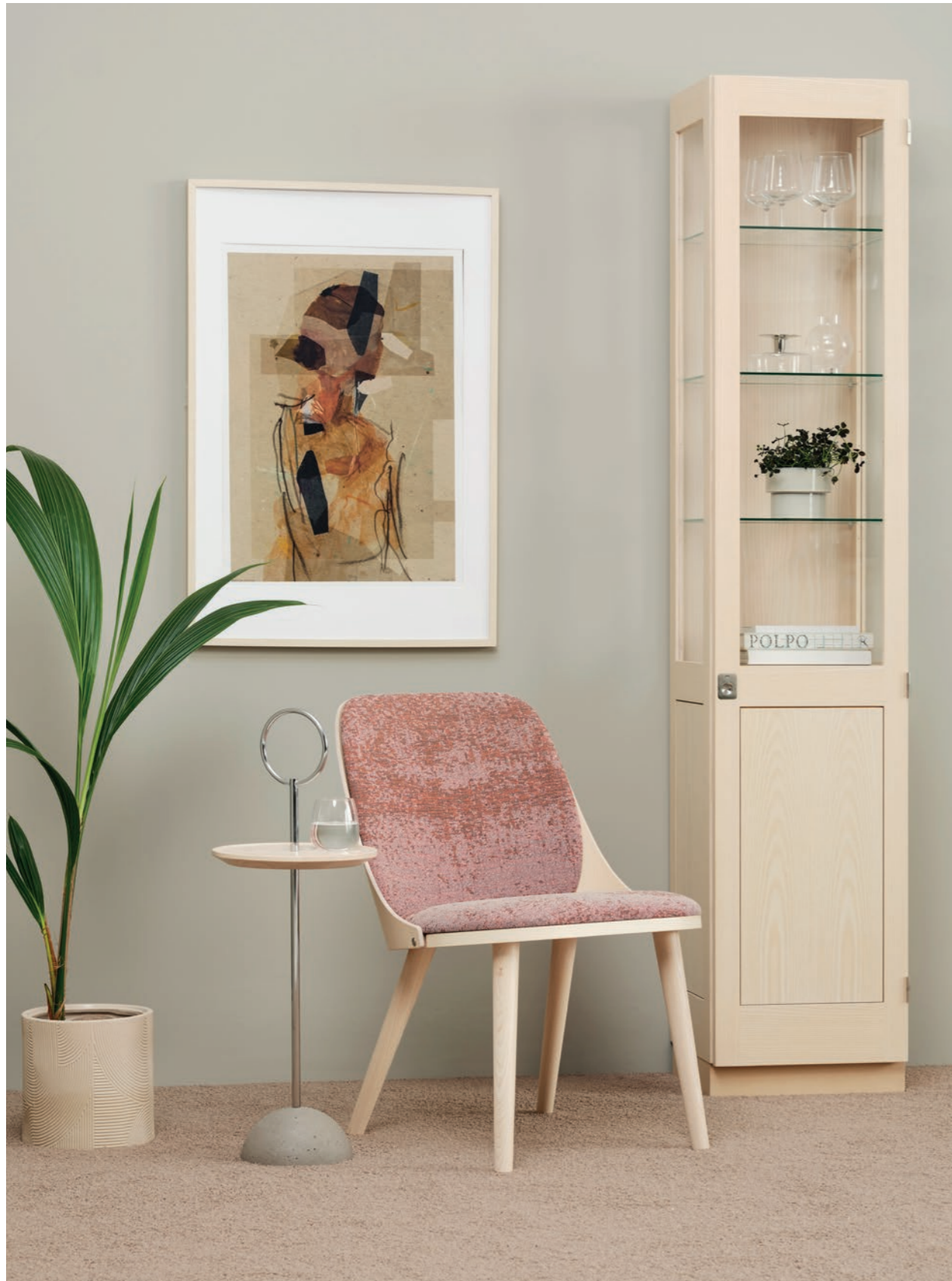
Fåtölj Easy chair SAF110 | Bord Table LOLLIPOP | Skåp Cabinet KA72