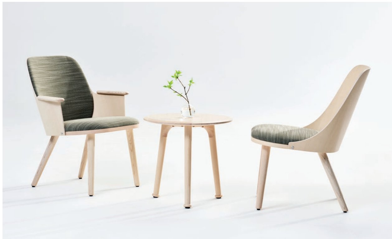
Fåtölj Easy Chair SAF210, SAF100 | Bord Table BAT