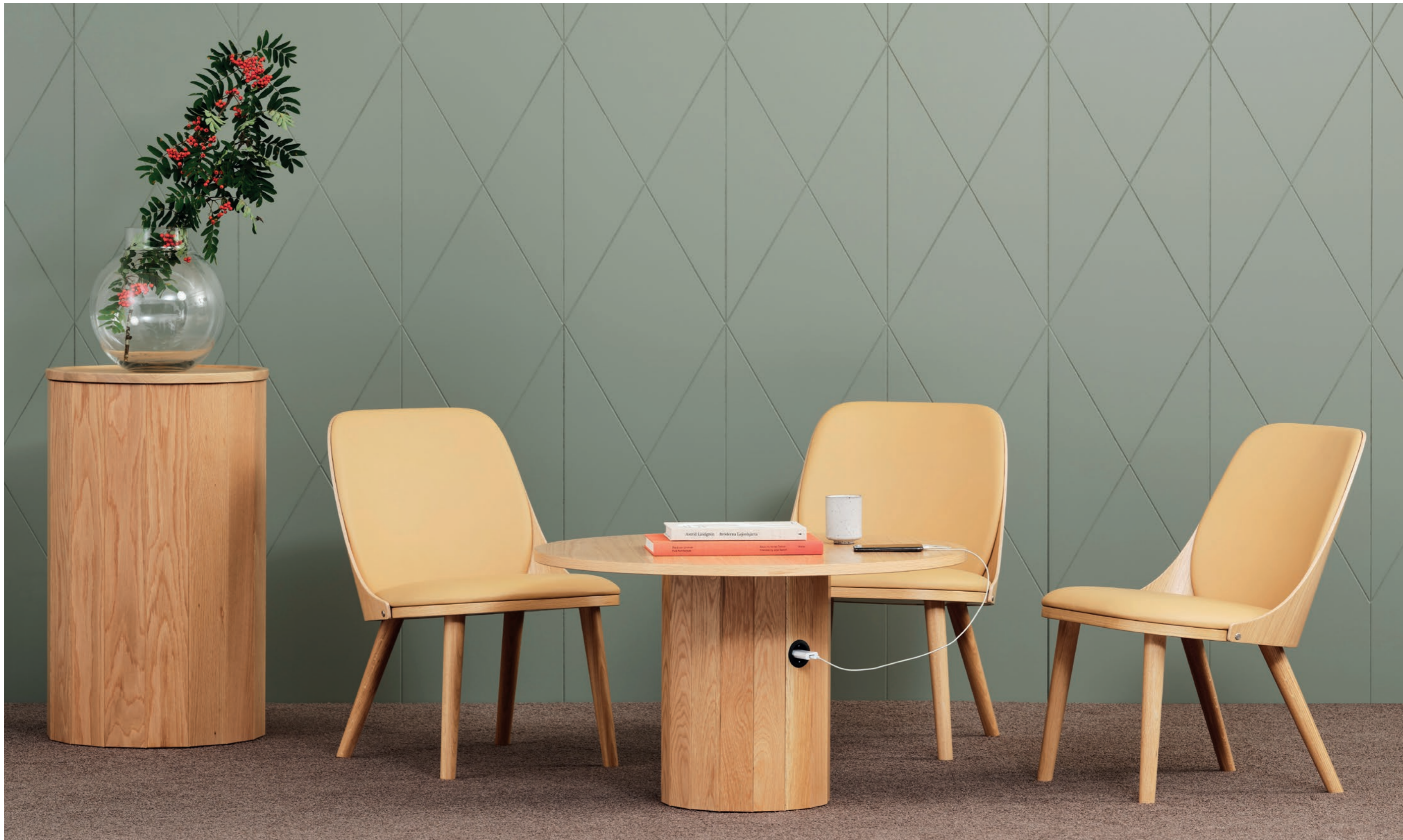
Fåtölj Easy chair SAF110 | Bord Table CAP incl. eluttag electrical outlet TKB11C | CAP PODIUM