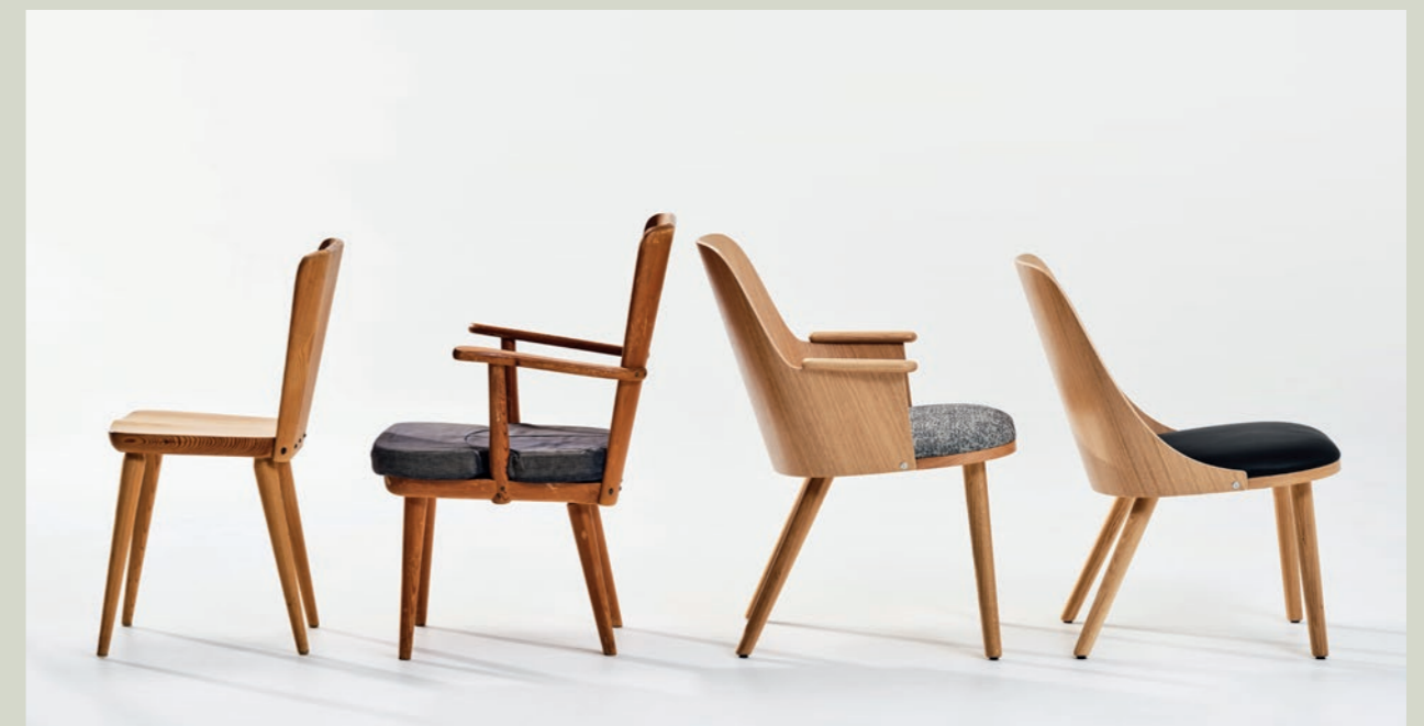
1951 Sportstugemöbel Svensk Fur vs 2021 Sander