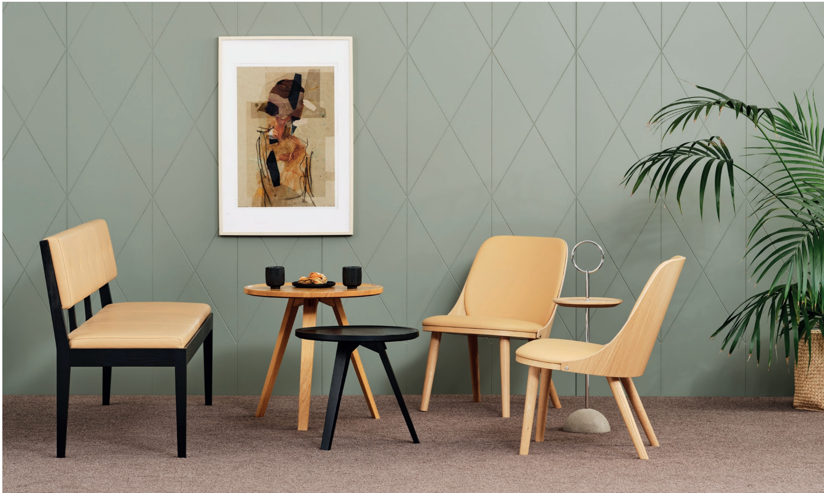
Fåtölj Easy chair SAF110 | Bord Table MILL, LOLLIPOP | Soffa Sofa FACILE