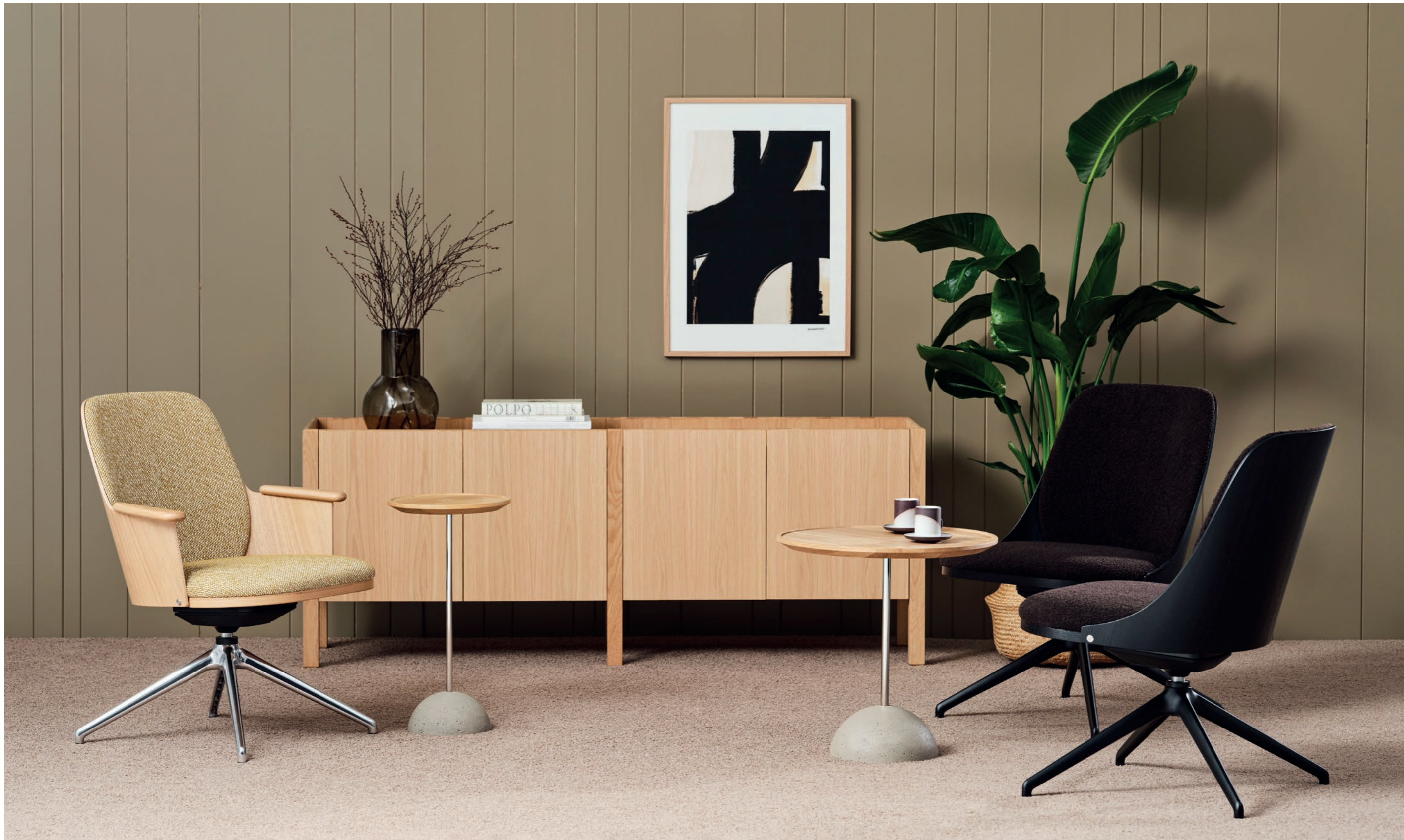
Fåtölj Easy chair SAF211p med mattpolerad fot incl. matte polished base, SAF111s med svart fot incl. black base | Sofford Sofa table LOLLIPOP | Skåp Cabinet UPPER