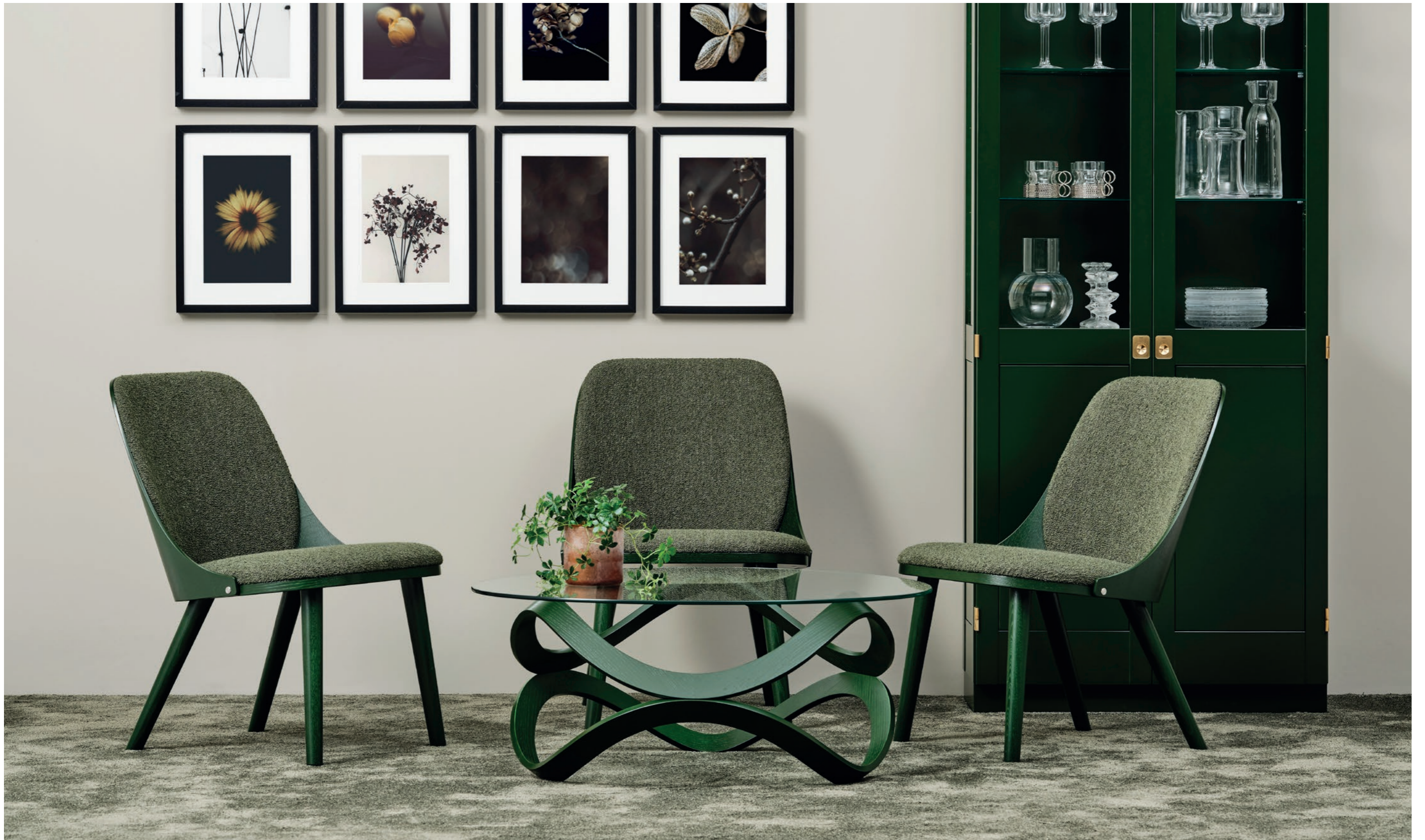
Fåtölj Easy Chair SAF110 | Bord Table NEWTON | Skåp Cabinet KA72 | Speciallack/bets Special color/stain NCS S8010-G30Y, green