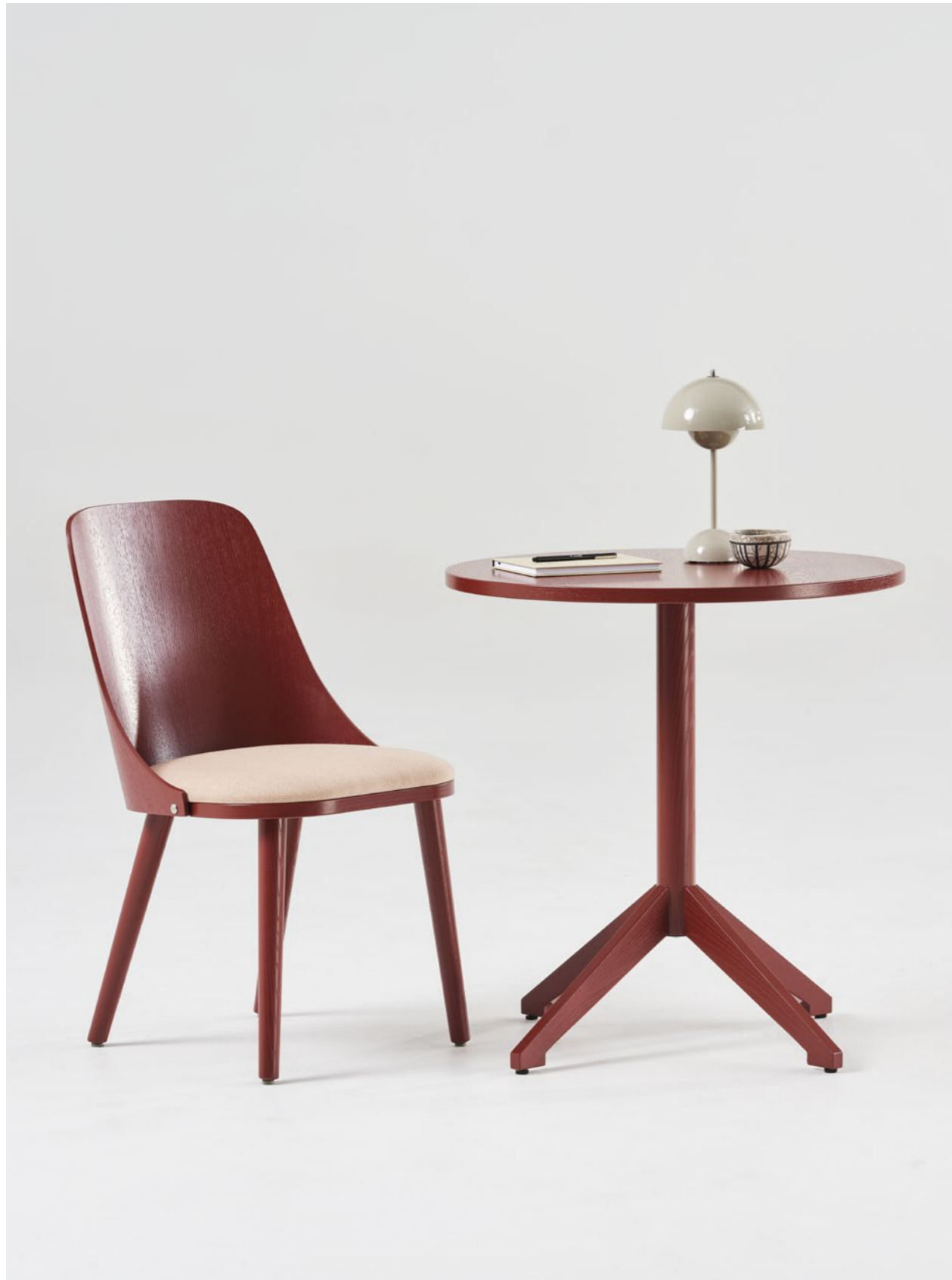
Stol Chair SAS500 | Pelarbord Pedestal table LOCUS specialfärg special color NCS S6030-Y90R röd red