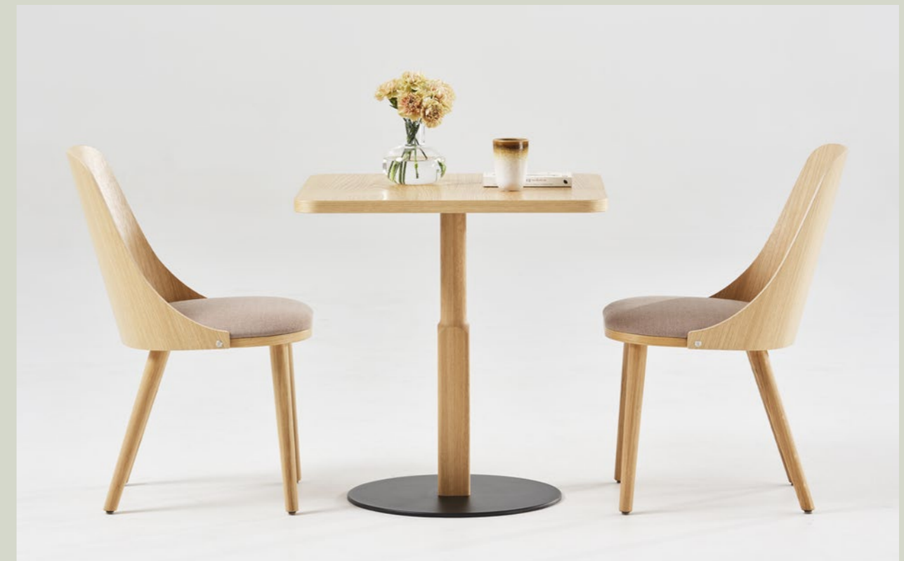
Stol Chair SAS500 | Pelarbord Pedestal table WOODWORK