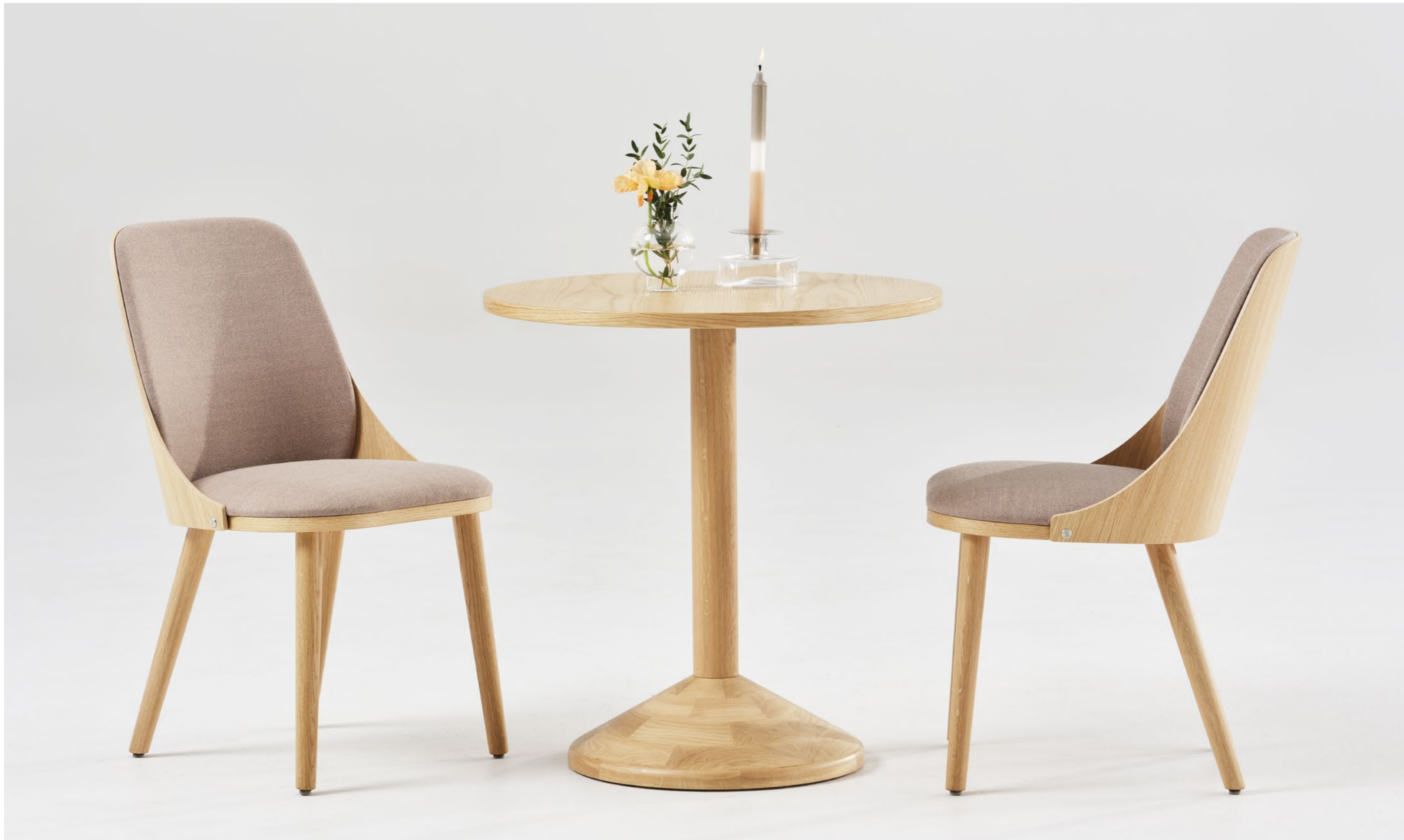
Stol Chair SAS510 | Pelarbord Pedestal table PIVÅ