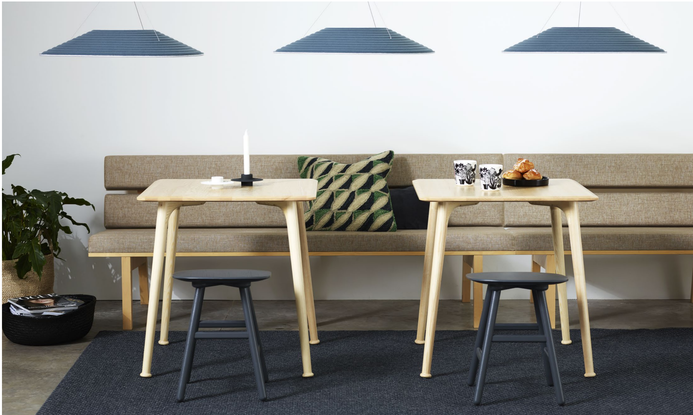
Ljudabsorbent Sound absorber REW165 | Bord Table BAT | Soffa Sofa KAMÓN | Pall Stool SHELL