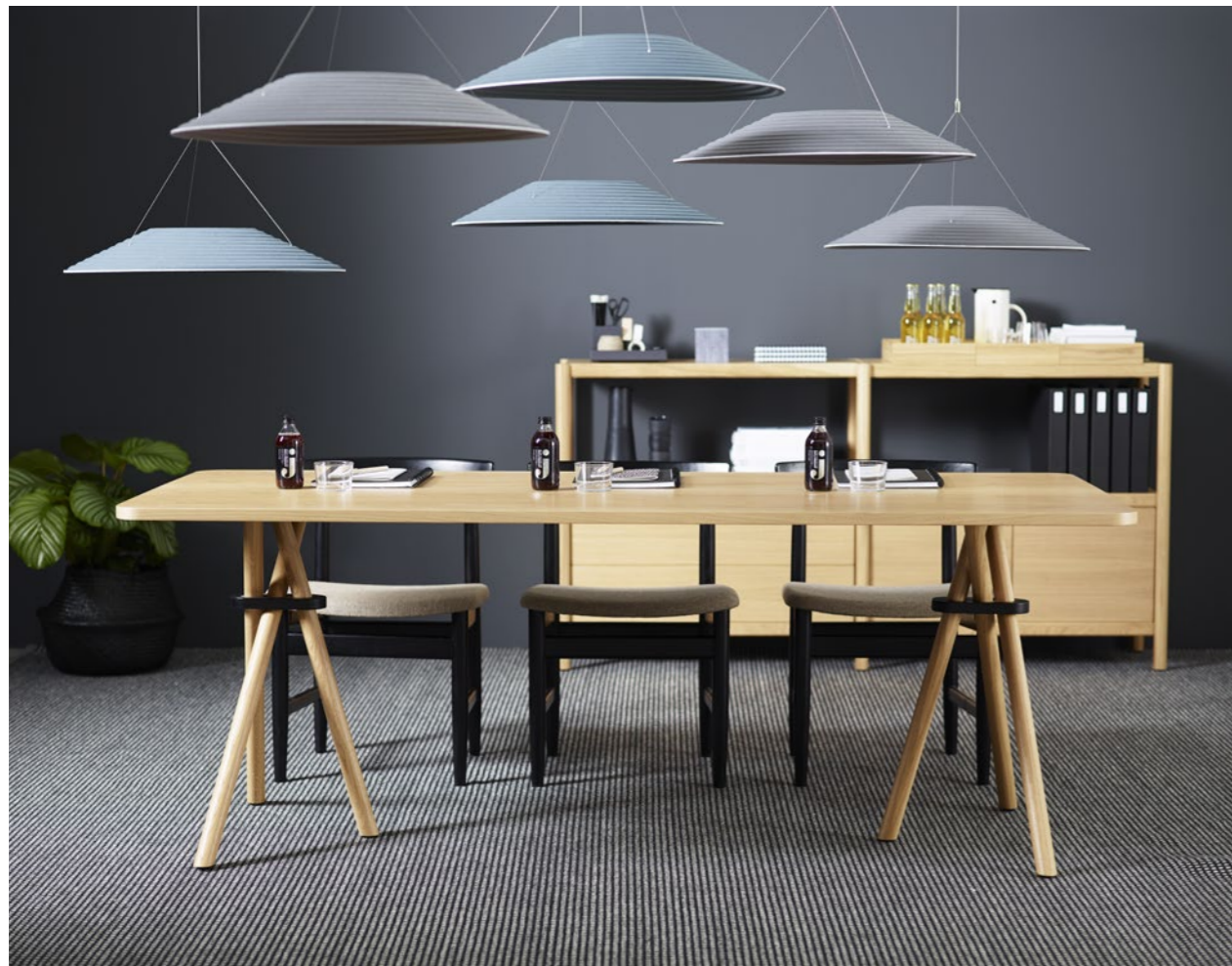
Ljudabsorbent Sound absorber REW165 | Skåp Shelf CAVETTO | Bord Table BOUQUET | Stol Chair ÖRESUND | Belysning från Lighting from Örsjö