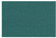
S08: 67048 Turkos Turquoise