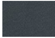
S04: 60154 Gråblå Gray blue