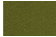
S10: 68103 Grön Green