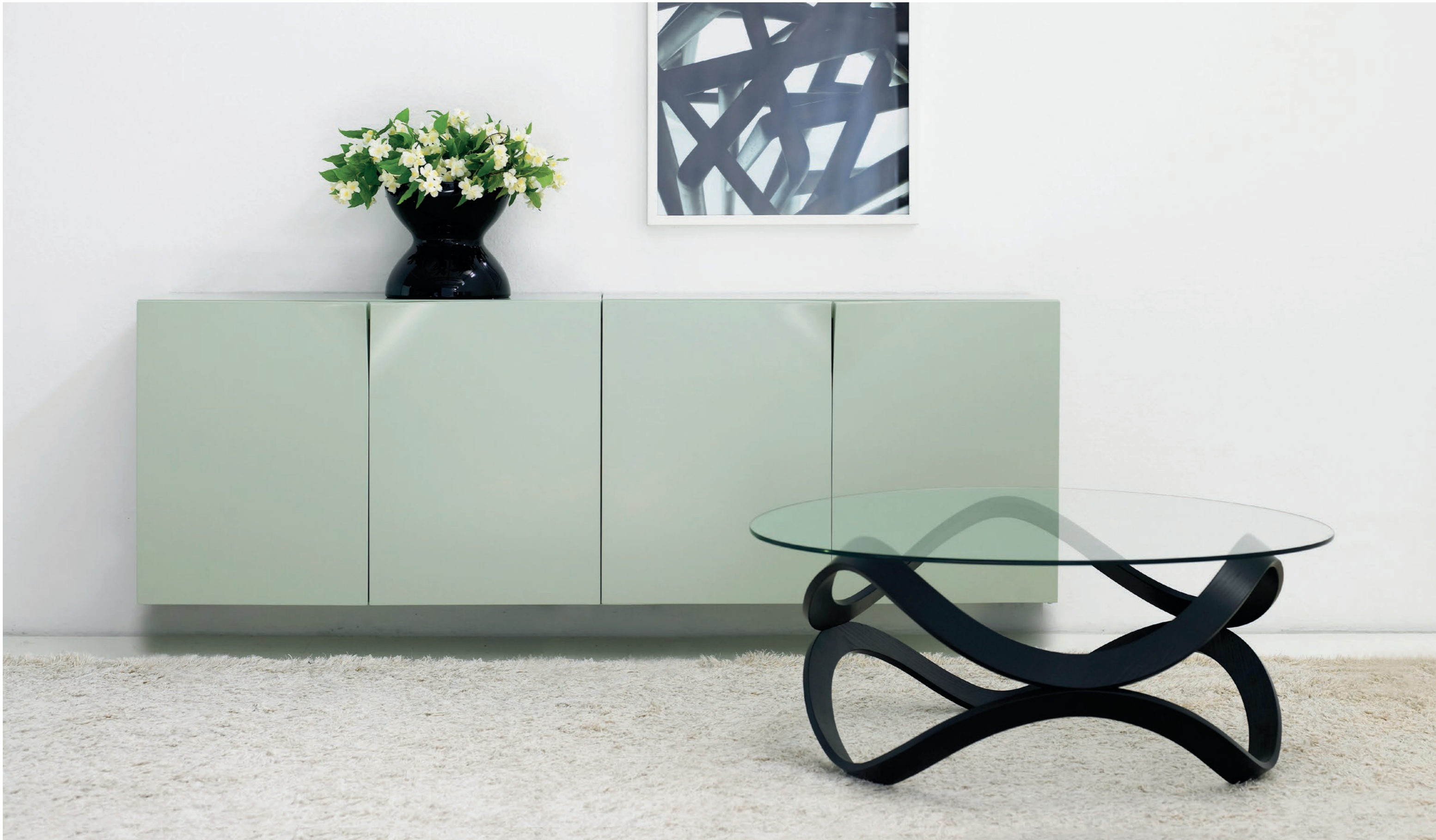
Bord Table NW 2592 | Skåp Cabinet MRS BILL