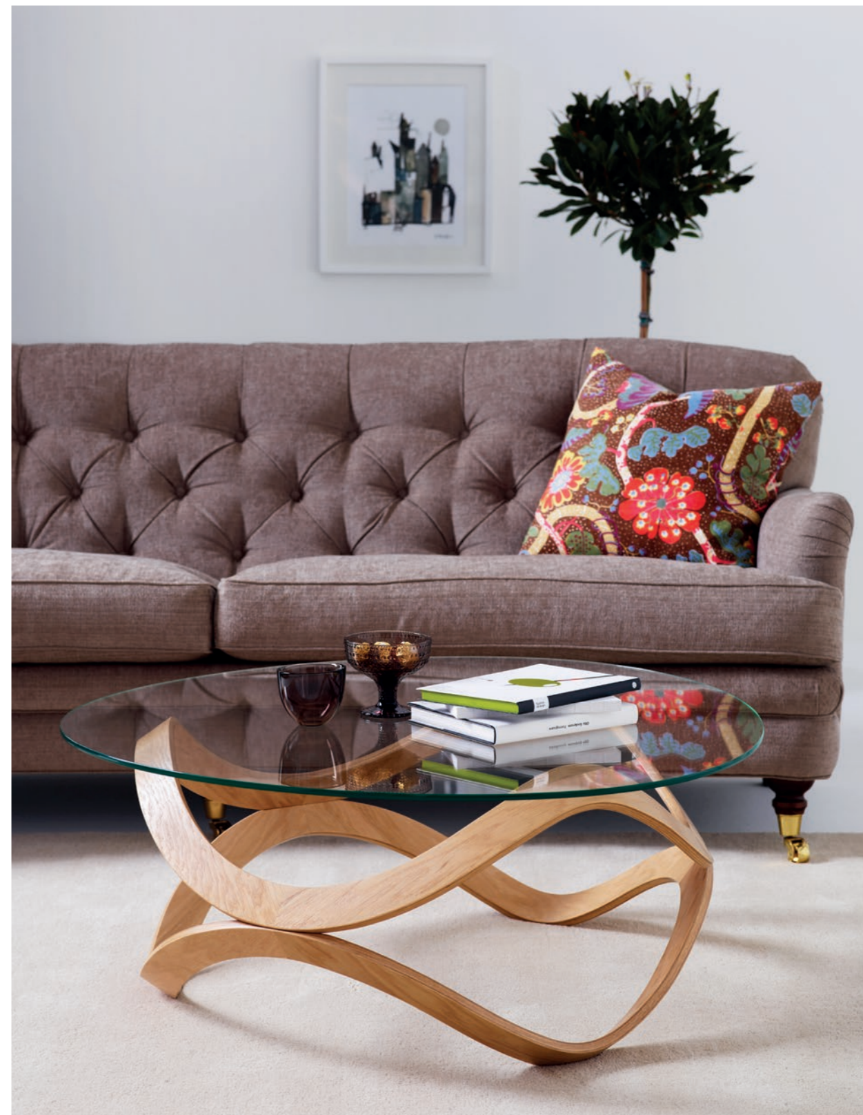
Bord Table NW2592