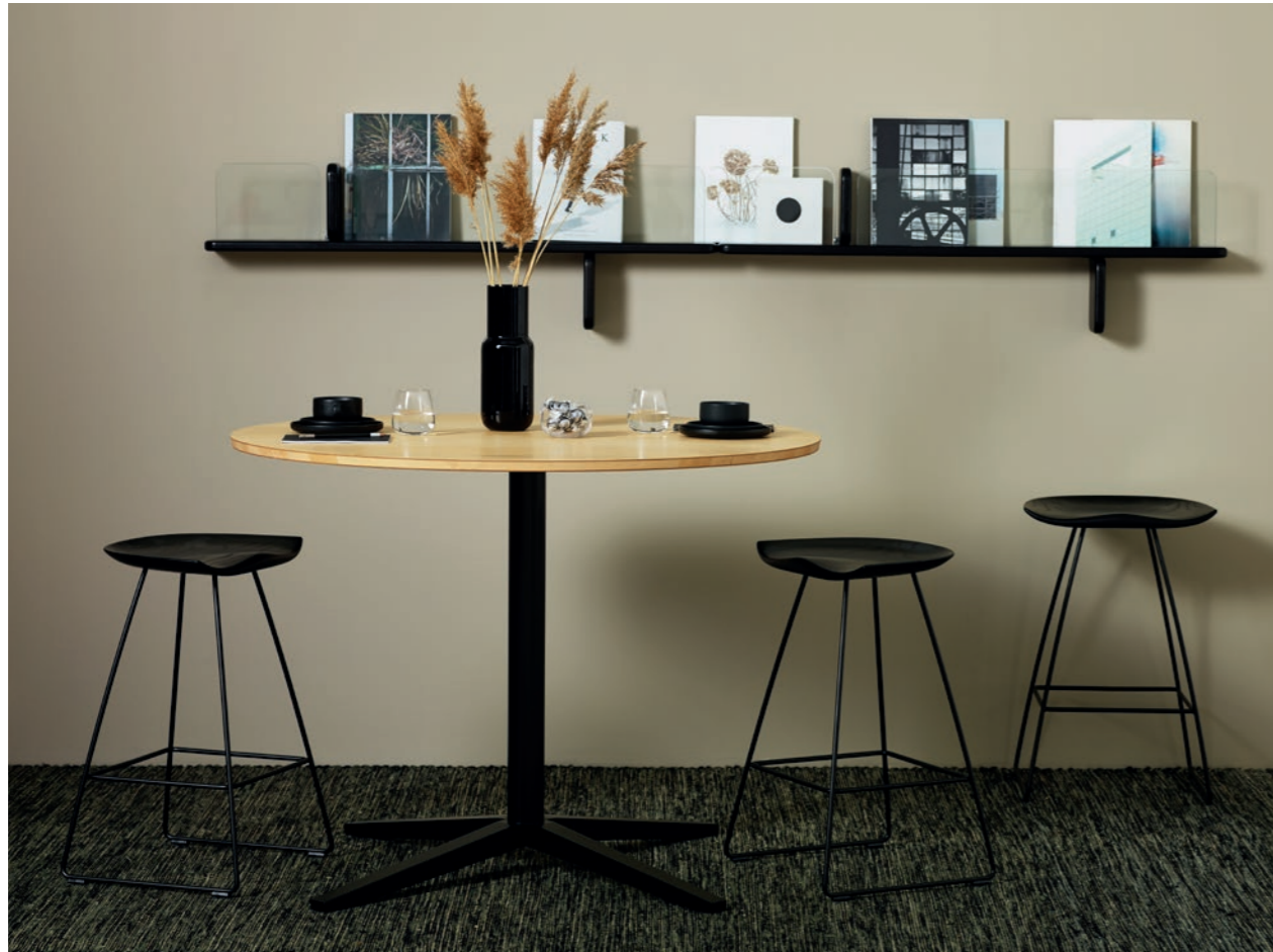
Pall Stool KAZP65S | Bord Table CROSS | Hylla Storage PART