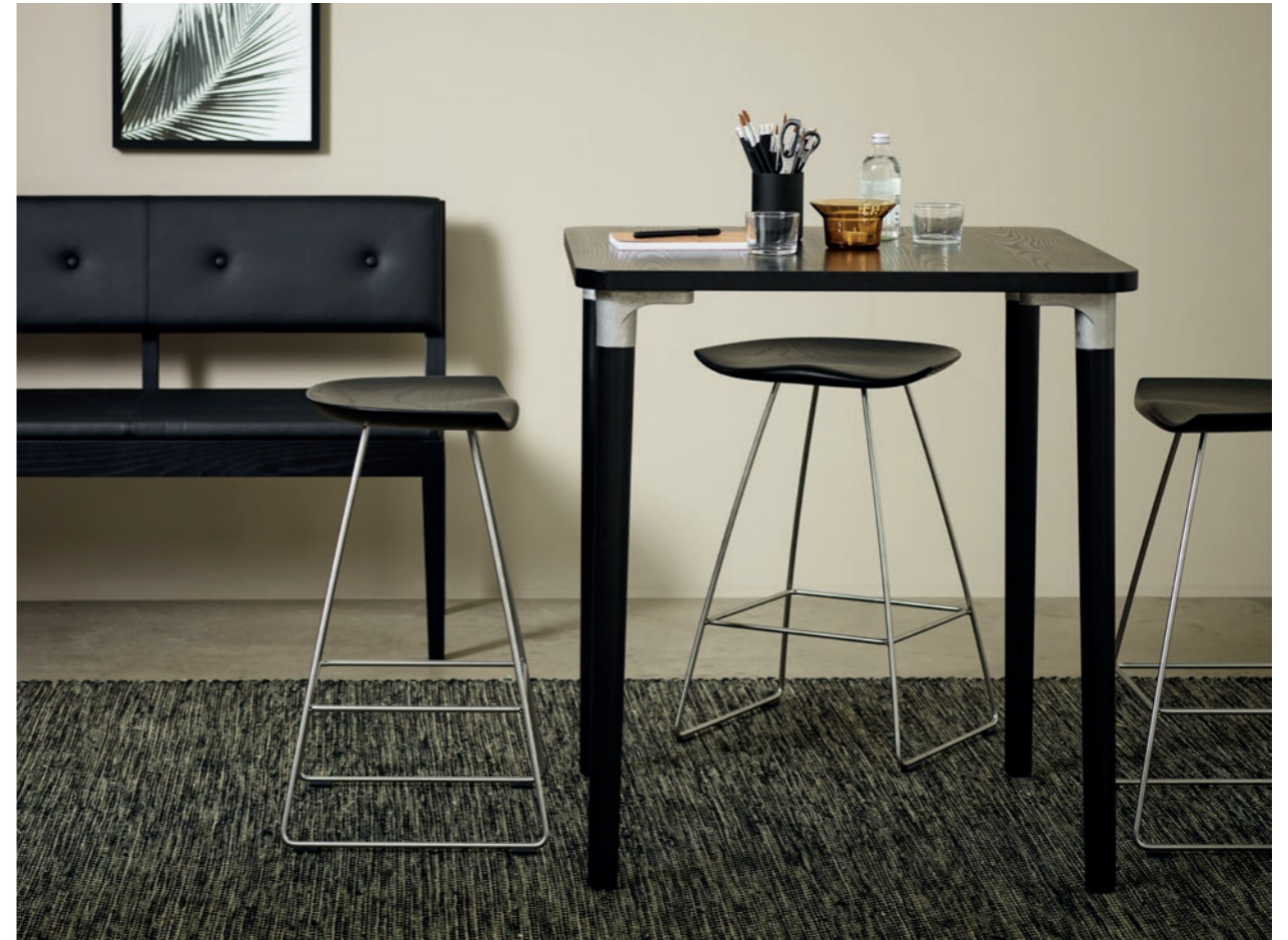
Pall Stool KAZP65M | Bord Table TAILOR | Soffa Sofa FACILE