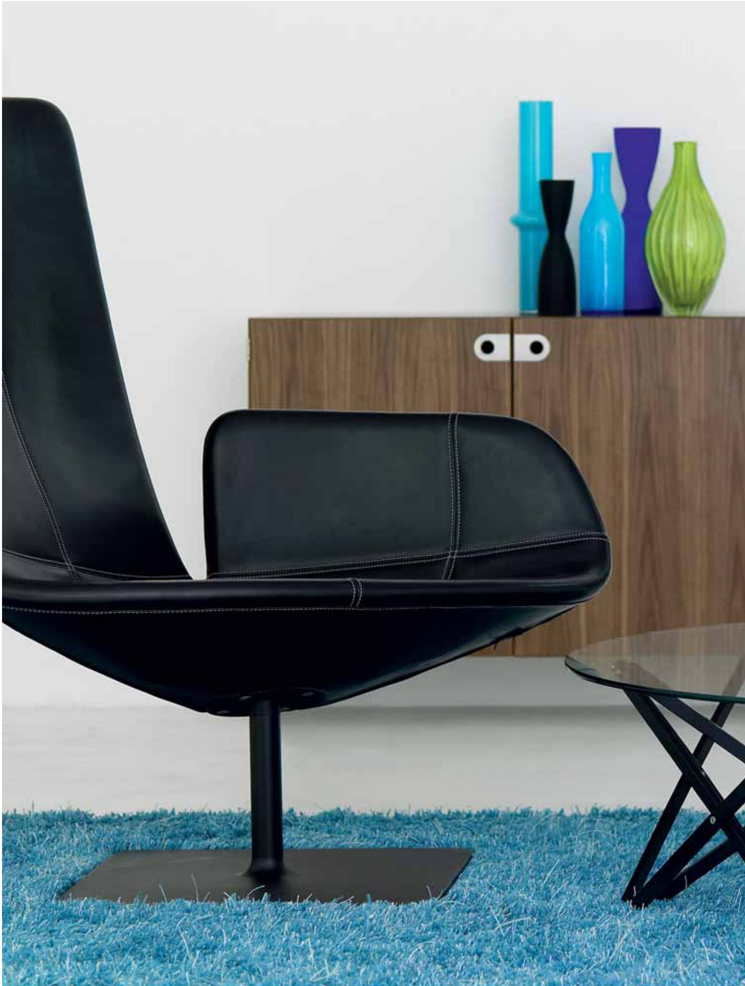
bord IT 13105-2, 2K-skåp, fätölj från Moroso