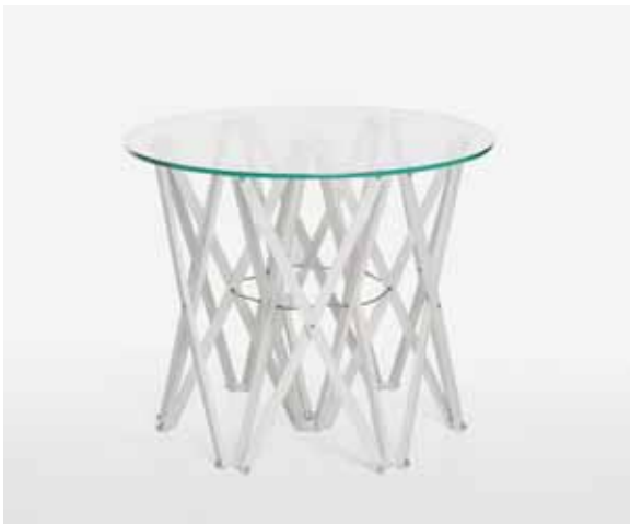
Artnr IT 1360-2 H500 Ø600