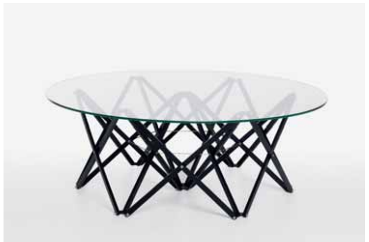
Artnr IT 13105-2 H330 Ø1050