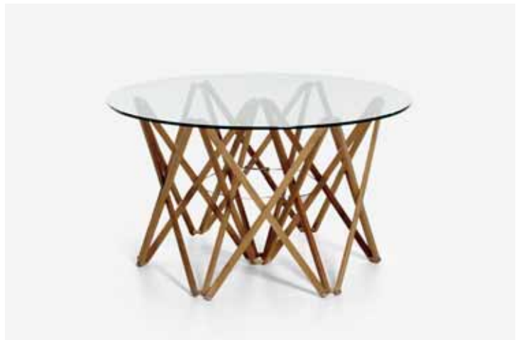
Artnr IT 1380-2 H450 Ø800