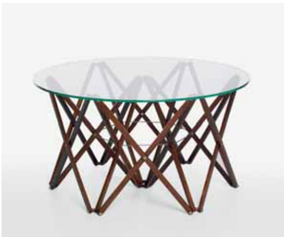
Artnr IT 1392-2 H400 Ø920